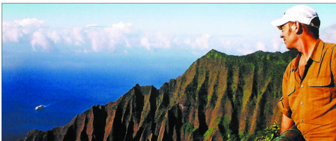
El autor, frente a los acantilados de la costa de Napali, en la isla hawaiana de Kauai.