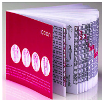
Icoon incluye 2.000 dibujos y fotos.

■ Icoon se puede comprar online en la página www.icoon-book.com . Precio: 8,90 euros más costes de envío.