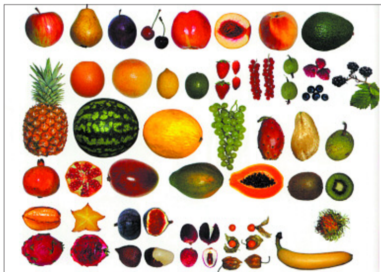
Frutas en Icoon. También hay páginas de verduras, especias, frutos secos, dulces, quesos...